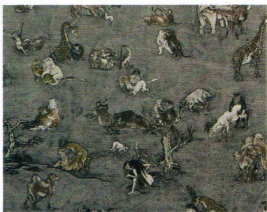
Yang Jiechang, Stranger than Paradise 1 , 2010-2011, encre et pigments sur soie, 145 x 450 cm, détail (GALERIE JEANNE-BUCHER/JAEGER BUCHER, PARIS).