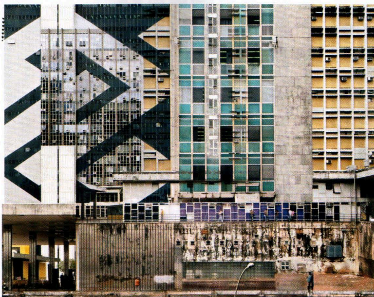
Stéphane Couturier, Brasilia, Setor bancario n°1 , 2009, C-Print, 160 x 200 cm, éd. de 5 ex., série Melting Point Brasilia , (GALERIE POLARIS, PARIS).

« YANG JIECHANG, TALE OF 11 TH DAY », galerie Jeanne-Bucher, 53, rue de Seine, 75006 Paris 01 44 41 69 65 www.jeanne-bucher.com du 13 octobre au 26 novembre et galerie Jaeger Bucher, 5 £ 7, rue de Saintonge 75003 Paris 01 42 72 60 42 www.galeriejaegerbucher.com du 20 octobre au 30 décembre ; « LE MONDE VOUS APPARTIENT », Palazzo Grassi, Venise www.palazzo-grassi.it du 2 juin au 31 décembre.